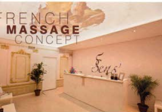
Spa à Los Angeles

de produits extralarge et sans jointure répond parfaitement aux attentes du monde de l'événementiel, du stand et de la décoration intérieure. Une pléiade d'avantages qui explique le pouvoir de séduction de la sublimation auprès des donneurs d'ordre aujourd'hui, et sans doute plus encore demain... Figarol a profité de la période estivale pour multiplier les essais, pousser l'imprimante et développer une offre complémentaire de médias. « La société TTS nous accompagne pour mettre